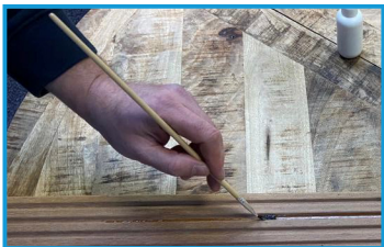
Stap 3: De primer verdelen in de gehele groef. Nu minimaal 30 min. wachten