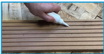
Stap 2: Primer aanbrengen