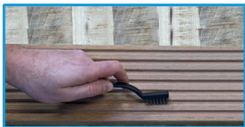
Stap 1: De groef uitborstelen