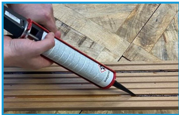
Stap 4: De kit aanbrengen