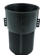
1 X CL