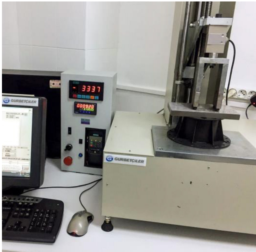
1/1: druklast evenredig verdeeld op de volledige bovenzijde

In dit rapport worden de druklasten per tegeldrager weergegeven op basis van een druktekst op de volledige bovenkant van de tegeldrager, op de helft en op een kwart.