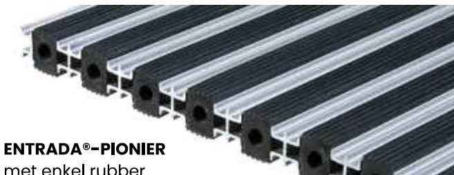
ENTRADA®-PIONIER met enkel rubber

Dagelijks: reinigen met stofzuiger Maandelijks: afnemen met harde borstel Jaarlijks: uit de matput nemen, reinigen met water en borstel, laten drogen en terugplaatsen.