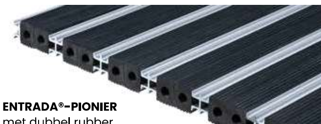
ENTRADA®-PIONIER met dubbel rubber