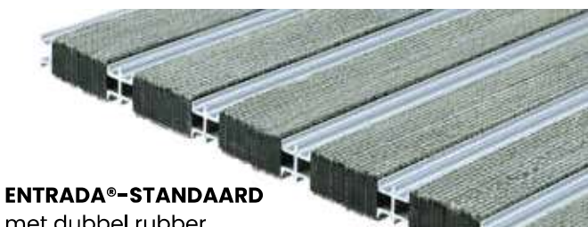
ENTRADA®-STANDAARD met dubbel rubber