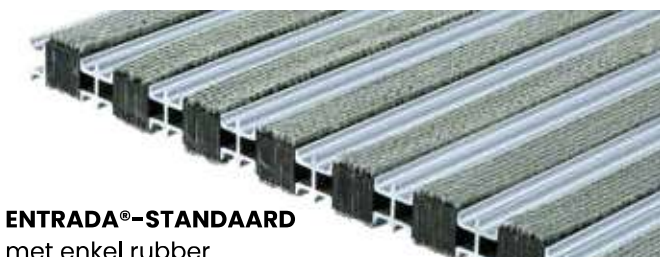
ENTRADA®-STANDAARD met enkel rubber