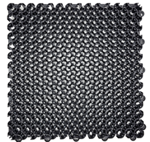
EMMAT ECO MODULAIRE TEGEL 8300 SCHRAAPTEGEL