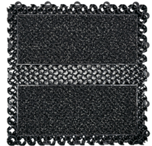
EMMAT ECO MODULAIRE TEGEL 8900 VOORZIEN VAN FORZA AQUA 85 DROGENDE TAPIJTINLAGE