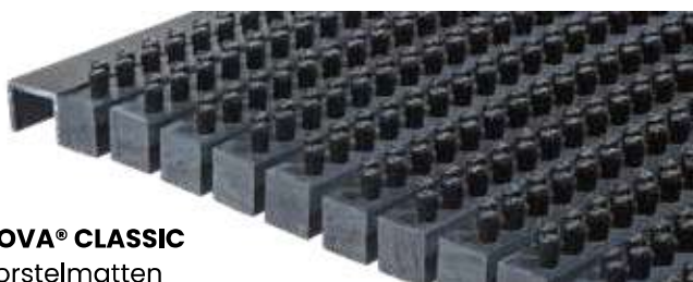
NOVA® CLASSIC borstelmatten